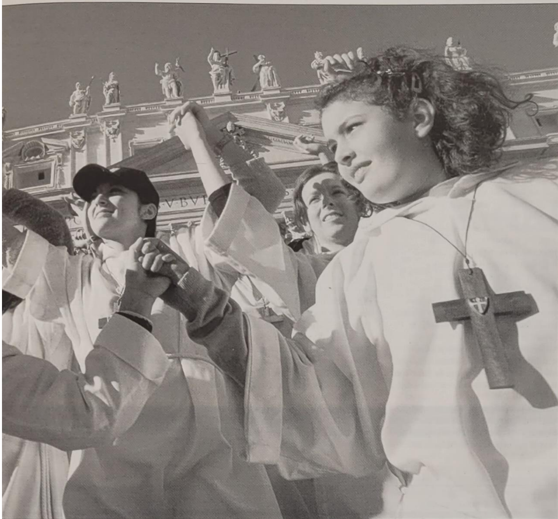
Hand in hand staat een groot kinderkoor op het Sint-Pietersplein te wachten op de aankomst van de paus. Samen zouden zij de eerste grote Jubileumviering, het Kinderjubiläum, vieren.